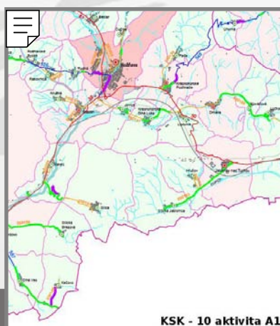
KSK - 10 aktivita A1